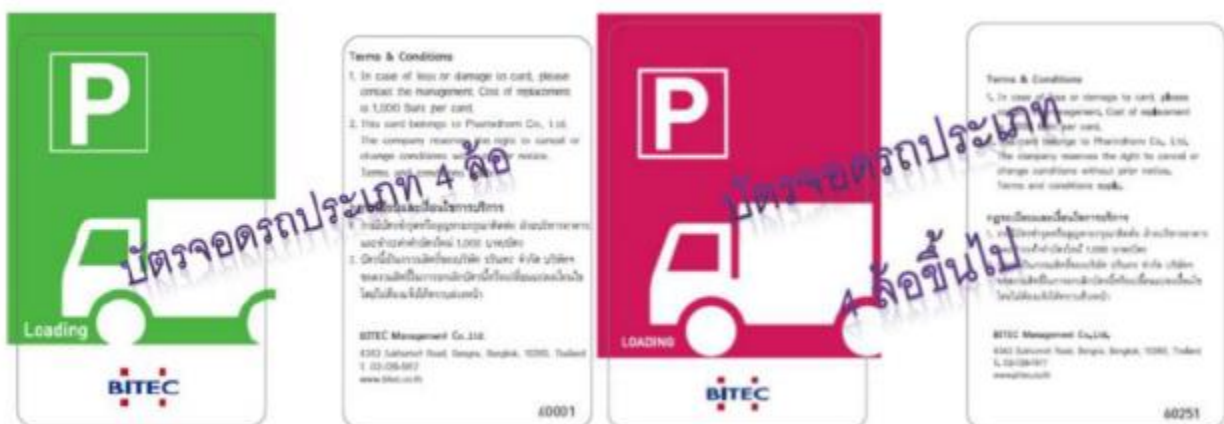
ตัวอย่างบัตรลงเวลาของทาง Bitec สำหรับจุดขนถ่ายสินค้า